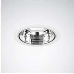
Inperla Ligra C07, LED-downlighter, plafondopening Ø 210 mm