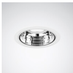
Inperla Ligra C07 LED, downlight, foro da incasso a soffitto Ø 210 mm