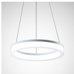
Luminaire suspendu LED Polaron