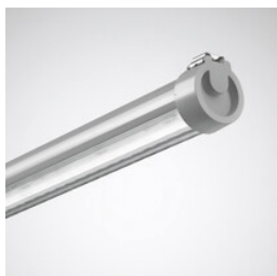
Plafonnier LED Duroxo IP69K

Le luminaire Duroxo G2 LED est absolument étanche au gaz ; et il défie sans aucun problème tout autant les vapeurs d'ammoniac et de soufre que l'eau et les produits chimiques de nettoyage. Dans des environnements exigeants (entrepôts de pneus ou tunnels de lavage, ...), il assure un éclairage éco-énergétique d'excellente qualité pendant 100 000 heures de service (L80 à tq 35 °C).