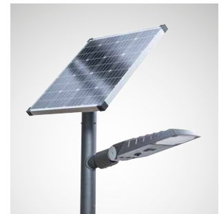
LUMEGA IQ 50N