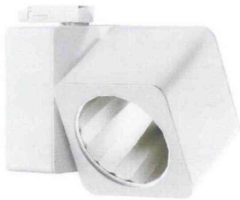
Fano Spot •