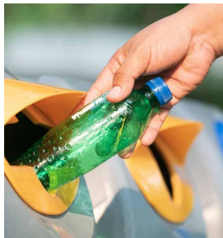
Plastique de post-consommation provenant de bouteilles en plastique collectées