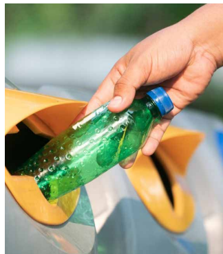
Post-Consumer-Kunststoff aus gesammelten Plastikflaschen