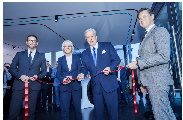
Elfi Scho-Antwerpes, Bürgermeisterin der Stadt Köln, durchschneidet als Ehrengast symbolisch das rote Band zur Eröffnung des neuen TRILUX Standortes in der Domstadt.