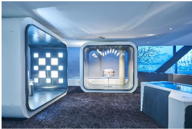
Verschiedene Produkt- und Themenkuben im Showroom zeigen wechselnde Exponate. Ein interaktiver Touchtisch macht das Medienerlebnis perfekt.