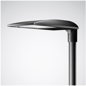
[Foto: TRILUX_ Jovie_LED_1] Die vielseitige Außenleuchte TRILUX Jovie LED setzt auf modernes, puristisches Bauhaus-Design und punktet dabei mit Reduktion statt Extravaganz.